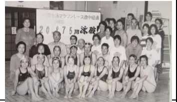
水泳教室参加者の推移