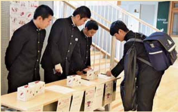
赤崎中学校では、応援委員会が生徒に募金を呼びかけました

昨年10月から実施した赤い羽根共同募金には、平成30年12月28日現在、一般募金5,729,313円、歳末たすけあい募金3,385,926円の善意が寄せられました。運動の趣旨をご理解いただき、ご協力いただきました。ありがとうございます。