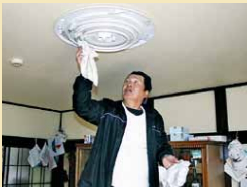
高齢者が手の届かない場所も点検・清掃しました

時には、皆にっこり。「脚立に乗るのが怖くて、高い場所の掃除はできなかった。普段、掃除できないところまで綺麗にしてもらってありがたい」「最近、ほこりなどに引火して火事になるニュースを見ることが多く、不安を感じていた。プロの方に点検してもらい、お墨付きをいただいたので安心だ」といった感謝の声が聞かれました。