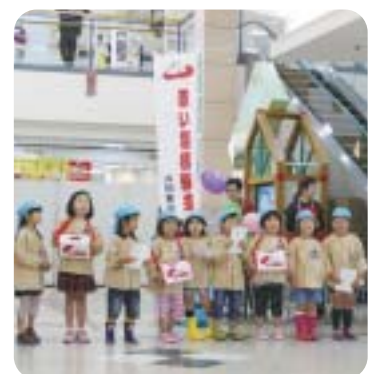
毎年たくさんのご協力をいただいている「共同募金」。(写真は昨年度)

(団体・家族の部、個人の部)、パネルシアター(お話)、ゲーム(鯉のウロコゲーム、鯉のぼり紙ヒコーキ大会)