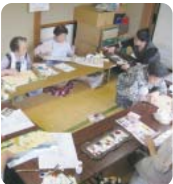
「つるおいとやすらぎの家」で手芸を楽しむ皆さん。（写真は昨年度）