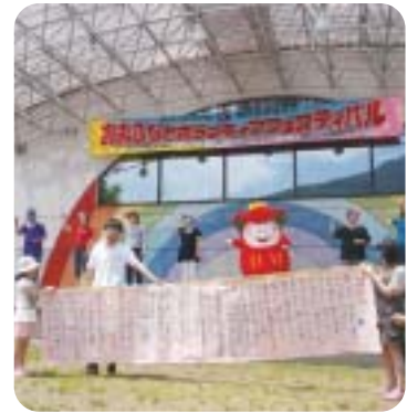
ボランティアと市民の交流イベント「ボランティアフェスティバル」(写真は昨年度)