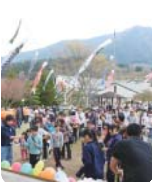
たくさんの鯉のぼりが泳ぐ下で元気に遊びましょう!(写真は昨年度)

★ 鯉のぼりコンテスト作品募集 ご家族や子ども会などで作ったアイディアあふれる鯉のぼりを会場へお持ちください。当日「手作り鯉のぼりコーナー」で作った鯉のぼりも出品できます。 【問合せ先】大船渡市社会福祉協議会(Y・Sセンター内) ☎ 二七〇〇〇一