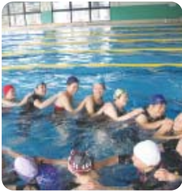
水泳教室で楽しく健康づくり。一緒にいかがですか。(写真は昨年度)