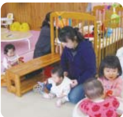
乳幼児とご家族のための「つどいの広場」。スタッフがいたので安心して遊べます。