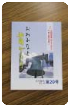
高齢者の経験と知恵が詰まった文集です。