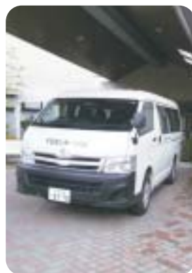
白いワゴン車が送迎します。

なお、盛町のサンリアとY・Sセンターを結ぶ無料の送迎車(定員九人)を運行しておりますのでご利用ください。