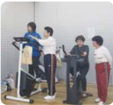
本格的な機器を使ってみましょう。丁寧に指導します。(写真は前回)