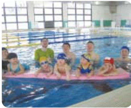
いっしょに水遊びを楽しみながら親子のふれあいをお楽しみください。(写真は前回)