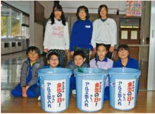
熊本への支援活動に取り組んでいる盛小学校JRC委員会の皆さん

盛小学校JRC委員会では、「金曜日は金缶の日」を合言葉にアルミ缶を集めて資源回収業者に買い取ってもらい、その代金を寄付する活動を行っています。今年度、同委員会では熊本地震で被災した方々を支援するために活動することに決め、多くの方から協力してもらおうと、児童と保護者宛てにお便りを配付。毎週木曜日には校内放送で協力を呼びかけ、金曜日の朝、