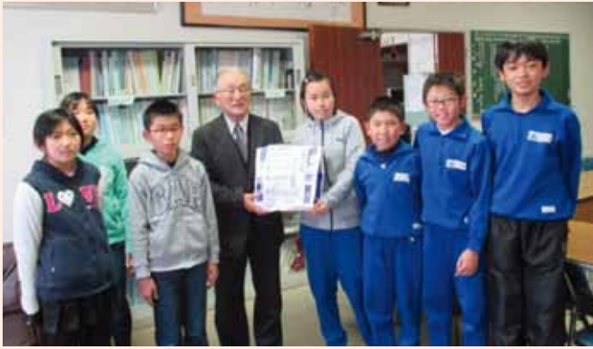
一般募金にご寄付いただいた立根小学校の皆さん

昨年10月から実施した赤い羽根共同募金には、平成29年1月12日現在、一般募金5、601、209円、歳末たすけあい募金3、314、192円の善意が寄せられました。運動の趣旨をご理解いただき、ご協力いただきました。ありがとうございます。