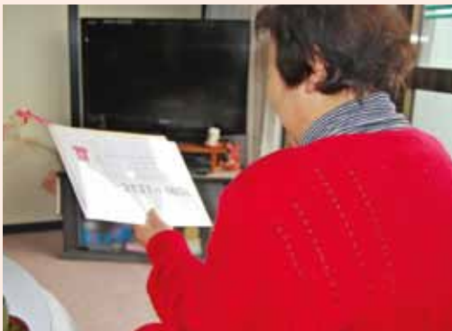
「具合が悪い」と発信した時には、電話をくれたり、様子を見に来てくれるので、安心して暮らすことができます。

社会福祉協議会では、高齢者の皆さんが自立しながら安心して生活が送れるよう、ご自宅の電話機を活用した見守り支援を行っています。